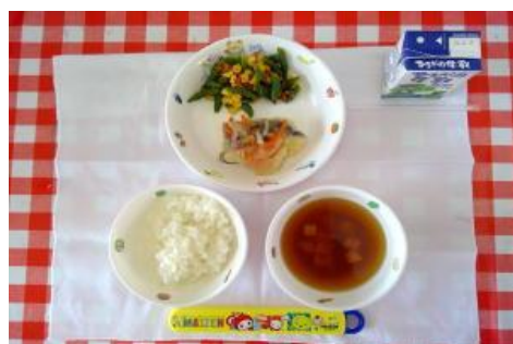
2/9【ごはん・魚の野菜あんかけ・ いんげんのおかか和え・みそ汁】