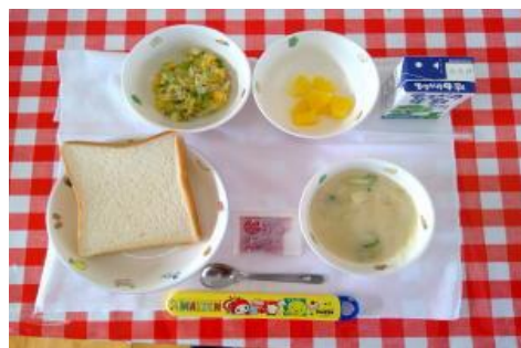
12/19【パン・クリームシチュー・ツナサラダ・ フルーツ】