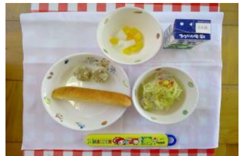
5/17【パン・ちゃんぽん麺・しゅうまい・ フルーツ杏仁】