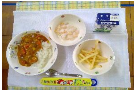
4/18【野菜たっぷりカレー・ フライドポテト・フルーツヨーグルト】