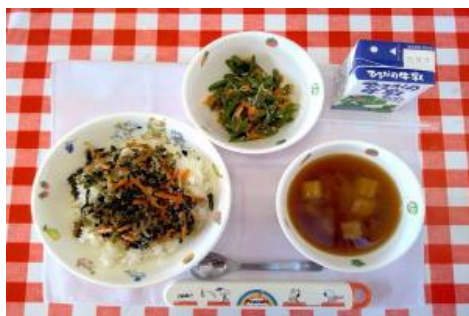
10/6【ビビンバ丼・いんげんサラダ・みそ汁】