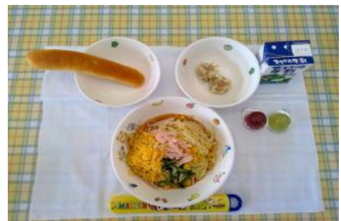
7/12【パン・冷やし中華・しゅうまい・ ーロゼリー】