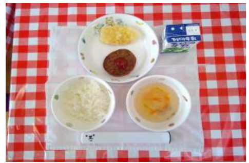
8/8【ごはん・ハンバーグ・ポテトのチーズ焼き・ コンソメスープ】