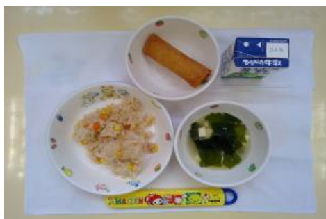
6/8【ツナコーンチャーハン・春巻き・ 中華スープ】