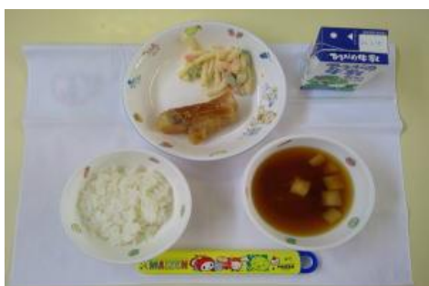
1/10【ごはん・煮魚・マカロニサラダ・みそ汁】