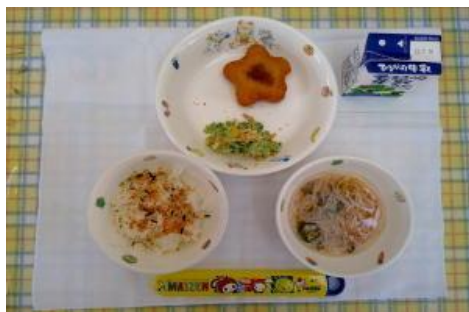
7/7【ごはん・ふりかけ・星のコロッケ・ ブロッコリーサラダ・そうめん汁】