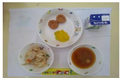
6/26【炊き込みごはん・がんも煮・ 南瓜サラダ・みそ汁】