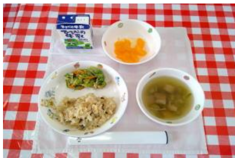
9/4【きのこごはん・サラダ・吸い物・フルーツ】