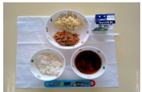
10/13【ごはん・豚肉の焼き肉風炒め・ 枝豆ポテトサラダ・みそ汁】