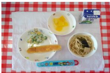
11/6【パン・わかめうどん・かにかまサラダ・ フルーツ】