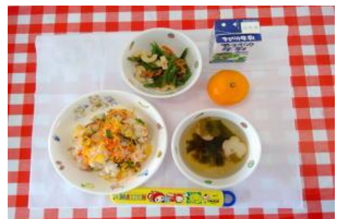
11/15【ちらし寿司・いんげんのごま和え・ 吸い物・みかん】