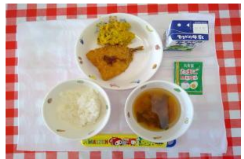
9/5【ごはん・ふりかけ・あじフライ・ 南瓜サラダ・みそ汁】