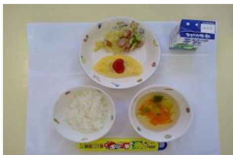
3/7【ごはん・オムレツ・ジャーマンポテト・ スープ】