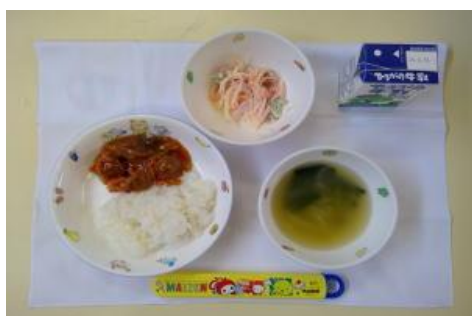
2/5【ごはん・肉団子の酢豚風・春雨サラダ・ 中華スープ】