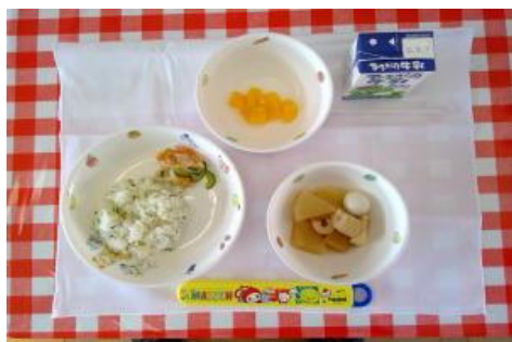
12/1【菜飯・おでん・チキンサラダ・フルーツ】