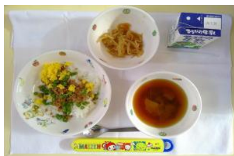
1/15【鶏そぼろ丼・切干大根の煮物・みそ汁】