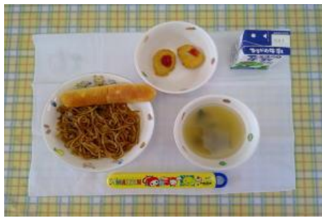
8/1【パン・焼きそば・チキンナゲット・ 中華スープ】