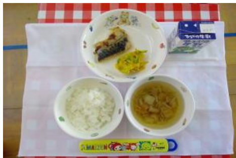
5/11【ごはん・鯖のみそ焼き・南瓜サラダ ・吸い物】