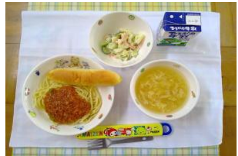
4/19【パン・ミートスパゲティ・ りんご入りサラダ・コーンスープ】