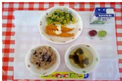
3/13【赤飯・エビフライ・花野菜サラダ・ 吸い物・ーロゼリー】